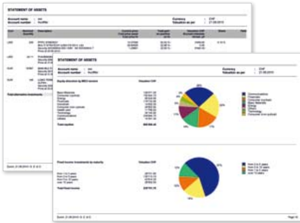
Neuer, kundenindividualisierter Depotauszug getreu dem eigenen Farbkonzept der P&P Bank